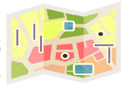
Schéma du règlement graphique